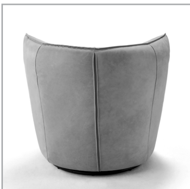
Dekorativer Reißverschluss im Rücken