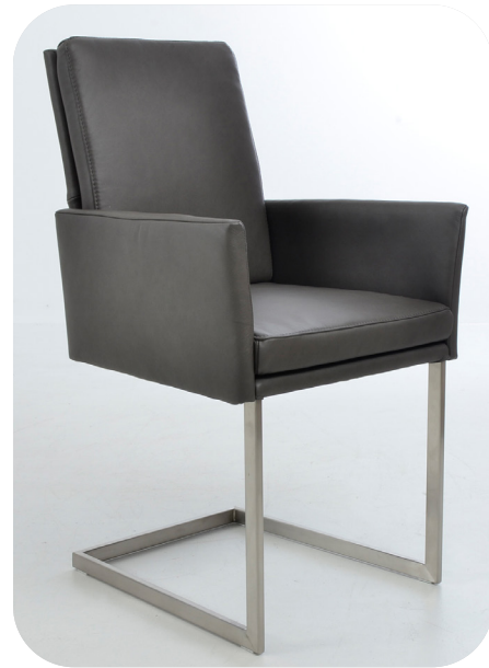
1B Freischwinger-Sessel Edelstahl optik gebürstet