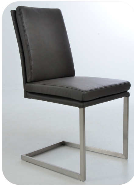
1A Freischwinger Edelstahl optik gebürstet