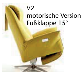
V2 motorische Version Fußklappe 15°