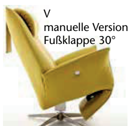
V manuelle Version Fußklappe 30°

Achtung: Das Fußteil der manuellen Funktion V ist nur dann ganz eingeschlagen (15°), wenn der Sessel „besessen“ wird, d.h. mit Körpergewicht belastet und ohne Belastung hat die Fußklappe einen Winkel von ca. 30° - zur Erleichterung der manuellen Auslösung.